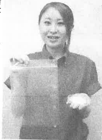
卵の殻を再利用した粉末抗菌剤を樹脂に配合した「鮮度保持フィルム」。左手は粉末抗菌剤

抗菌研究所栃木Lab(那須塩原市鹿野崎)は18日までに、卵の殻を再利用した粉末抗菌剤を開発した。樹脂に抗菌剤を配合した鮮度保持フィルムなどを9月から販売する。同研究所はホタテ貝殻を1200度の高温で焼いて作る抗菌剤「スカロー」を月約20ト生産している。スカローは強アルカリ性がある水酸化カルシウムの粉末